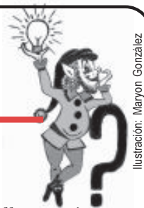
Ilustración: Maryon González