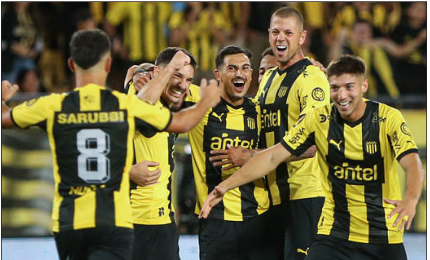
El festejo merecido de los jugadores de Peñarol después de uno de los golazos de anoche.